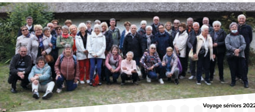
Voyage séniors 2022