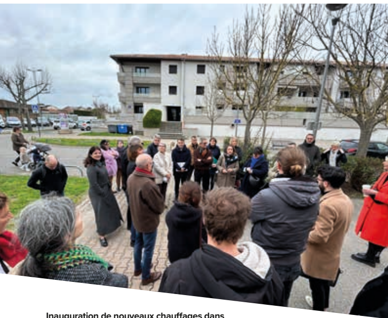
Inauguration de nouveaux chauffages dans les logements sociaux, quartier des Sables