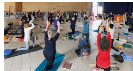
1 er journée du yoga organisée à la salle des fêtes pour les adhérents de l'association

Vous pouvez vous inscrire sur l'adresse mail ybe.launaguet@gmail.com afin de vous positionner pour un cours parmi les différents créneaux. Nous nous retrouvons à la Journée des associations pour valider les inscriptions définitives avec les paiements. /