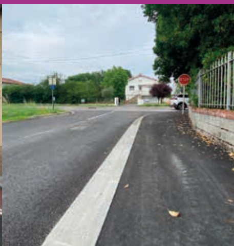
Impasse Renée Aspe