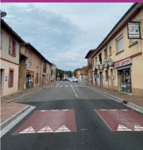
Chemin de la Palanque