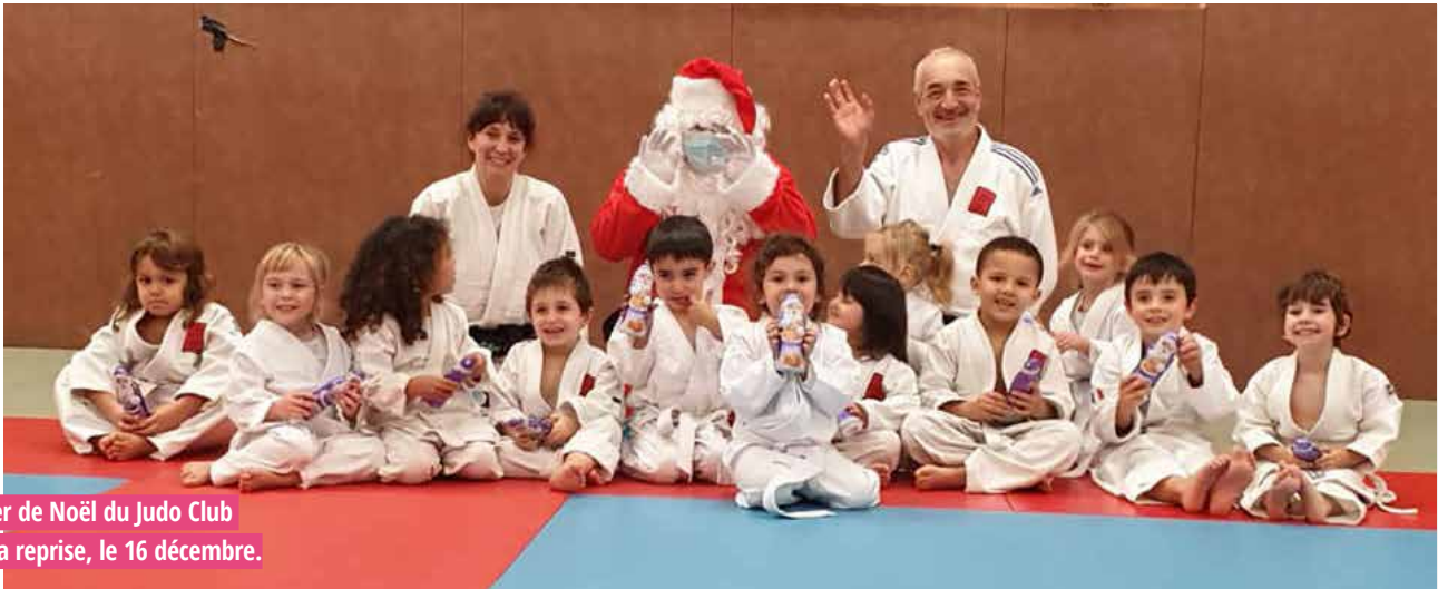
Le goûter de Noël du Judo Club lors de la reprise, le 16 décembre.