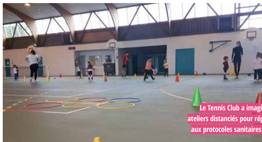
Le Tennis Club a imaginé des ateliers distanciés pour répondre aux protocoles sanitaires Covid.

En parallèle, les fédérations nationales ont transmis régulièrement des protocoles complets pour accompagner les présidents dans la reprise de leurs activités.