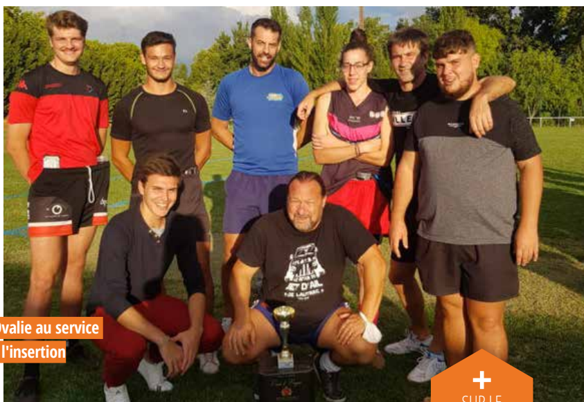
L'Ovalie au service de l'insertion