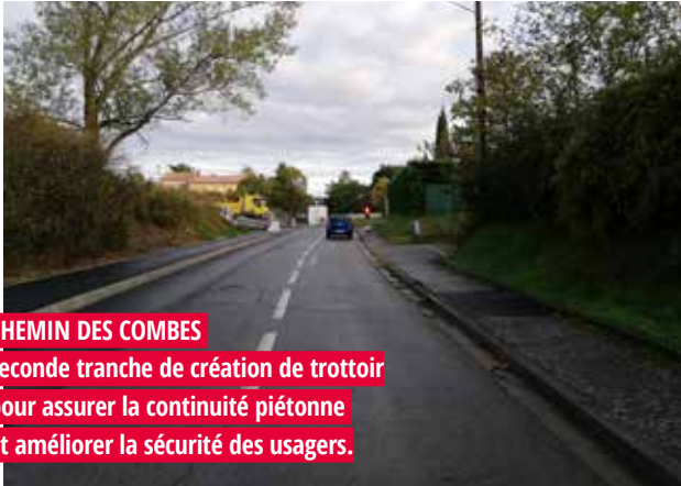
CHEMIN DES COMBES seconde tranche de création de trottoir pour assurer la continuité piétonne et améliorer la sécurité des usagers.

Dans le cadre de la programmation opérationnelle et budgétaire de la métropole, définie avec la municipalité de Launaguet, Toulouse Métropole entretient les voies et aménage l'espace public au bénéfice du cadre de vie des Launaguétois.