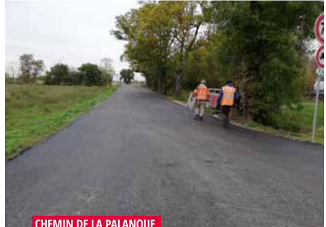
CHEMIN DE LA PALANQUE

Réfection de la couche de roulement entre le chemin des Sports et le Chemin de la Violette, pour renforcer la chaussée et entretenir les accotements. Cet aménagement permet d'améliorer la sécurité des automobilistes et des cyclistes, et de rénover l'aspect de l'espace public.