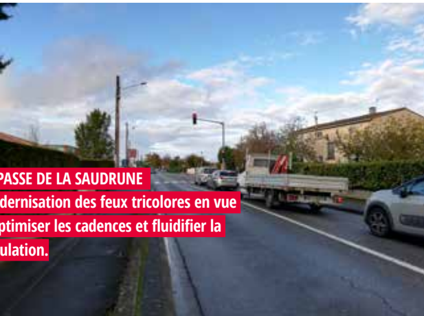
IMPASSE DE LA SAUDRUNE Modernisation des feux tricolores en vue d'optimiser les cadences et fluidifier la circulation.

Réfection de la couche de roulement entre le chemin des Sports et le Chemin de la Violette, pour renforcer la chaussée et entretenir les accotements. Cet aménagement permet d'améliorer la sécurité des automobilistes et des cyclistes, et de rénover l'aspect de l'espace public.