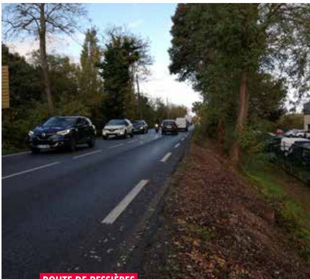
ROUTE DE BESSIÈRES

La ville de Launaguet a demandé l'inscription du financement de la sécurisation de la Route de Bessières entre le rond-point de l'Hôtel de ville et le rond-point de la Porte des Sables au Plan d'Aménagement Multimodal Métropolitain (PAMM) de Toulouse Métropole.