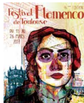
Affiche du Festival de flamenco de Toulouse réalisée par Anaïs Barrachina de La Muse en Goguette

5 mars - La Muse en Goguette 68 chemin Boudou - Launaguet