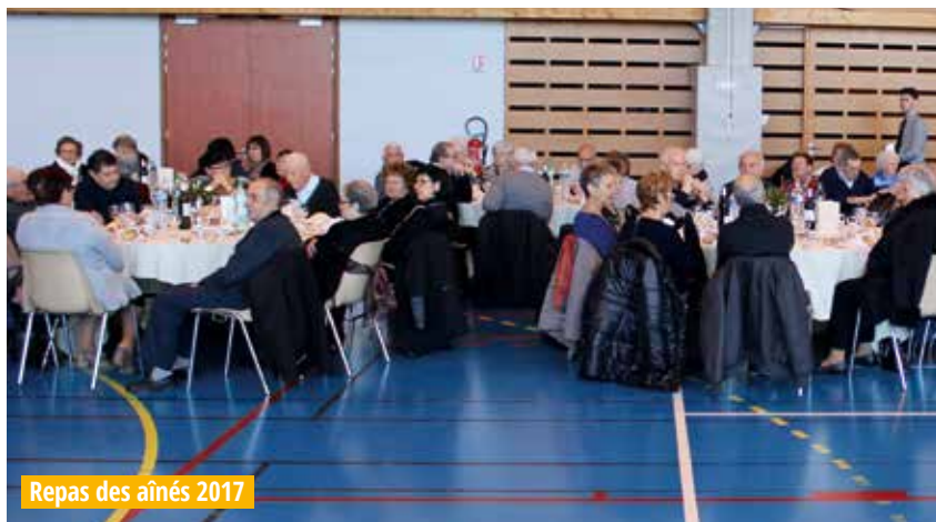
Repas des aînés 2017