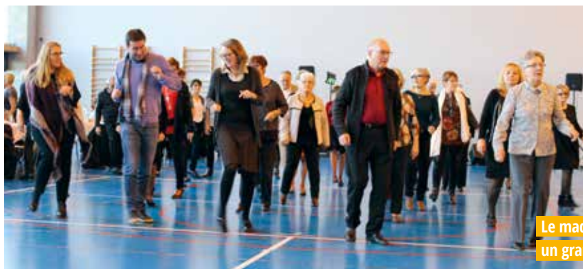
Le madison remporte toujours un grand succès